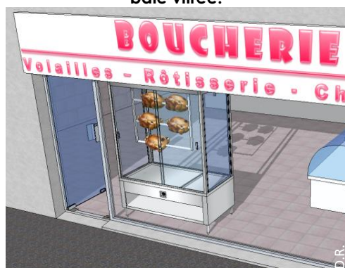
Un four, une rôtissoire, ou tout autre dispositif émettant une forte source de chaleur, à proximité de la baie vitrée.