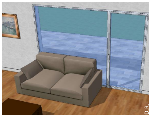
Un canapé (ou tout autre mobilier) plaqué contre la baie vitrée.

Voici des exemples de situations où le risque de casse thermique du vitrage est présent, et qu'il convient donc d'éviter :