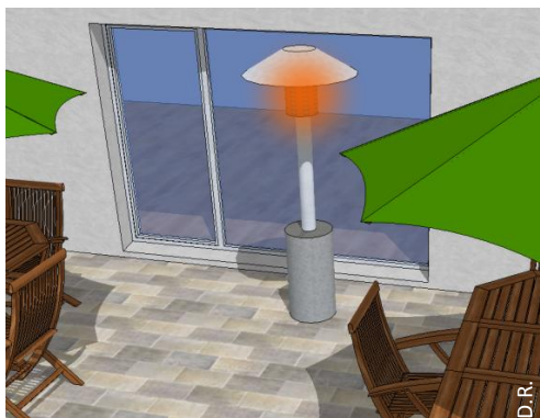
Un parasol chauffant, ou tout autre dispositif de chauffage à proximité de la baie vitrée.