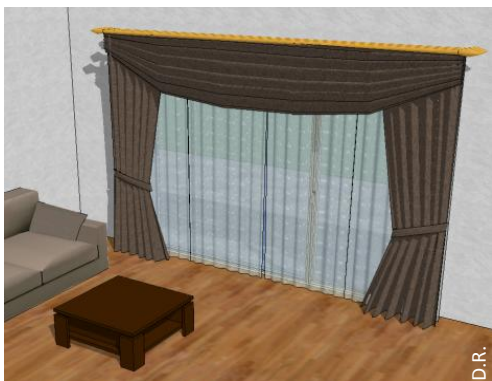
Un rideau foncé et opaque