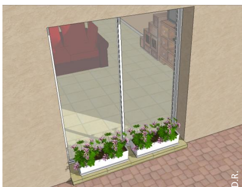
Une jardinière contre la baie vitrée, côté extérieur ou intérieur. Ou tout autre élément d'occultation.