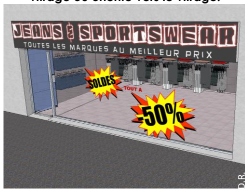
Des stickers de couleur foncée et contrastée sur les vitrages.