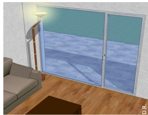
Un éclairage de type halogène à proximité du vitrage ou orienté vers le vitrage.